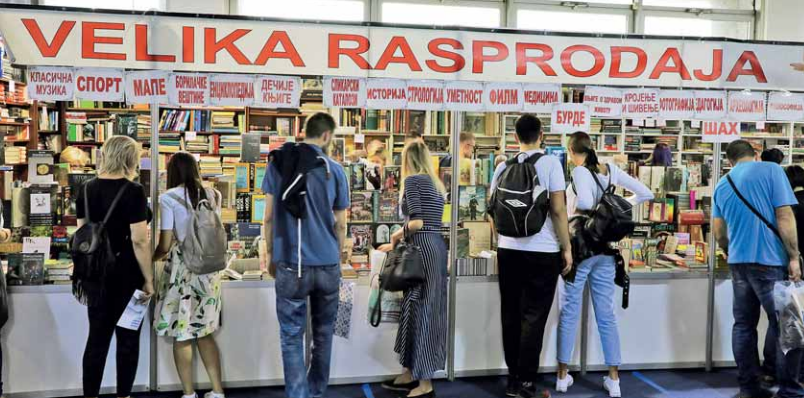
Сајам књига у Београду прилика је да се представе дела познатих књижевника и велики издавачи, али и самиздати непознатих аутора

велики број с обзиром на величину тржишта.