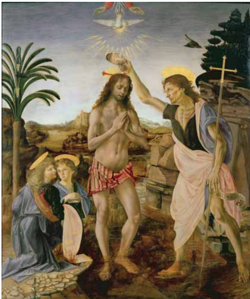
Slika 1. Krštenje Hristovo (Verokio i Leonardo)