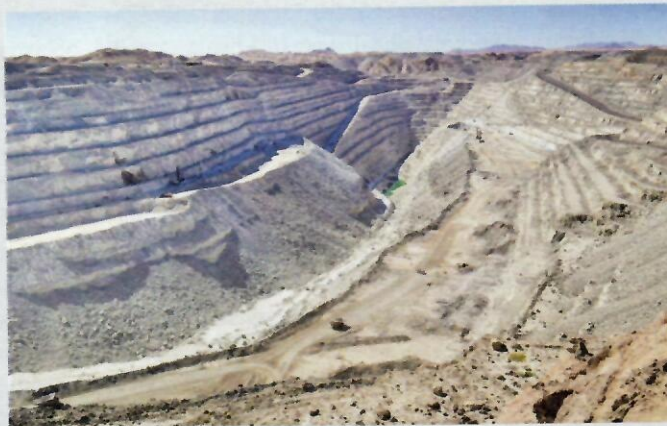
JEDAN OD MOĆNIKA SVETA: Rio Tinto

Razume se, vlade u centru svetskog kapitalističkog sistema i međunarodna tela za kreiranje politika i kontrolu tog sistema kao što su MMF, Svetska banka, Svetska trgovinska organizacija, Banka za međunarodna poravnanja, G7, G20, u službi su obezbeđenja slobodnog protoka kapitalnih investicija i osiguranja naplate duga svuda u svetu, pa su upravo zbog toga i u službi ovih finansijskih divova. Da to tako zaista bude, brine se 199 "menadžera", odnosno članova upravnih odbora ovih 17 kompanija, pošto se mno-