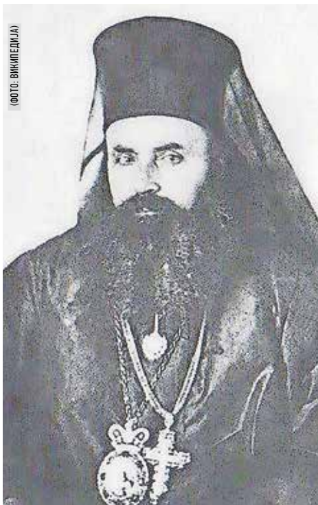
Митрополит београдски Петар Јовановић

жао на извјесној дистанци од осталих „немачкара“. Упамћен је и као изразито лијеп и наочит човјек, кога су прије замонашења звали „Лијепи Паја“. Био је свакоме приступачан и умио је, коме год затраже, да пружи добар савет. И у цркви, а и иначе, волио је да држи бесједе, проповиједи и подучава народ. Његовом заслугом одштампане су по први пут у Србији многе црквене књиге, од којих је велики број наслова био неопходан свештеницима за обављање свакодневне службе. Како је служио под Обреновићима, тако је наставао и под Александром Карађорђевићем. Био је редован гост на Двору, како приликом свечаних пријема највиших домаћих и страних званичника, које је уобичајавао кнез, тако и у свакодневници, најчешће да пружи савет кнежевој породици