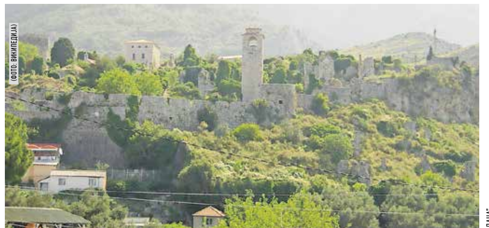
Остац старог Бара

ву папских була које су издаване дубровачким архиепископима током 12. вијека, јасно је да је и Дубровачка архиепископија протезала своју јурисдикцију над поменутим градовима у Дукљи. На Латеранском сабору одржаном 1215. није било разматрања питање јурисдикционих права барске и дубровачке цркве, иако је то било за очекивати будући да су њихови прелати позвани да присуствују сабору. Насљедник Иноћентија III, Хонорије III (1216–1227) је очигледно признавао новоосновану Барску архиепископију, јер је по започињању свог понтификата упутио писмо између осталих архиепископа и барском. Међутим, његов насљедник папа Гргур IX (1227–1241), на супрот томе, управо по започињању свог понтификата је издао булу дубровачком архиепископу којом потврђује његова јурисдикциона права над истим оним територијама које су биле признате дубровачком архиепископу према папским булама током 12. вијека, дакле над земљама Захумљем, Травунијом и Србијом „што је Босна“, и над