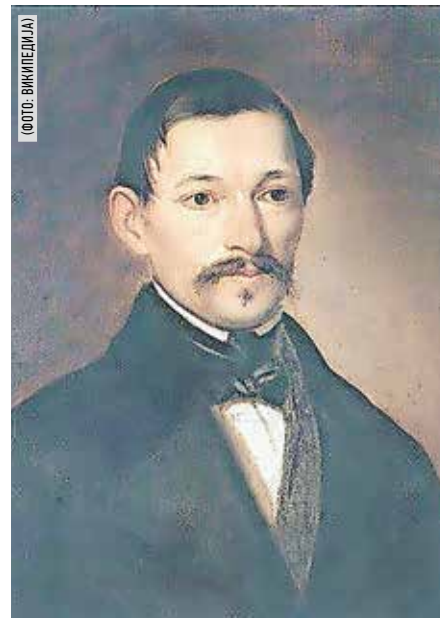
Јован Стерија Поповић, рад Јована Поповића