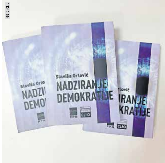
Насловница Орловићеве књиге

Када је слобода протјерана, честити људи да би сачували себе слободу траже „бјекством од друштва“. „Бјекство од слободе“ помаже ауторитарним режимима тиме што то значи да се разумни и честити људи повлаче из јавног живота. За јавно дјелање потребна је спремност да се плати одређена цијена. То је ризик да будете оспорени и оспоравани, етикетирани и жигосани, неријетко без аргумената и чињеница, али са страшћу и по цијену остра-