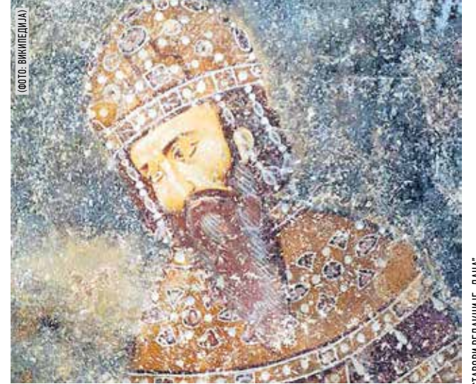
Краљ Стефан Урош I

узео стонску римокатоличку епископију и у Цркви Св. Богородице у Стону смјестио сједиште хумске епископије. У вријеме владе краља Уроша I и архиепископата Арсенија у Хуму је на власти био велики кнез Андреј, који је био брат од стрица његовог оца Стефана Првовјенчаног. По свој прилици на почетку своје владавине краљ Стефан Урош I је издао повељу манастиру Св. Богородице у Стону, односно хумској епископији, тзв. Стонску повељу. У аренији заправо пише да је краљ Урош разумјевши оно што је хумској епископији учинио његов отац краљ Стефан, својом повељом „исправио“ је тако што је Саборној цркви епископије, Дому Свете Богородице у Стону, даровао краљеве. Краљ Урош најприје наводи оне у Хумској земљи: село Бивоље Брдо с пољиштем и засеком Тополницом и Моругом, с међама како је „од пре било“. Потом дарује село Брштаник с међама и с виноградима, исто како је „од пре било“. У морском крају краљ Урош дарује село Живо-