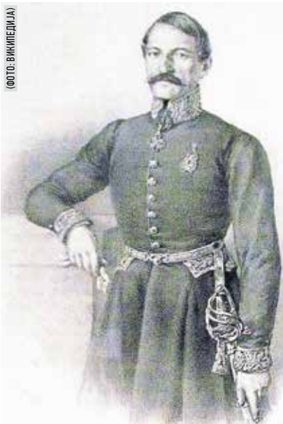
Илија Гарашанин, рад Анастаса Јовановића 1852. г

лије притиска Русије, Аустрије и Турске на кнеза Михаила да се помири са прогнаницима. Поново окупљени у Србији, уставобранитељи су почели убрзане припреме за рушење кнеза Михаила. У Вучићевој буни, септембра 1842. године, у сукобу с кнежевом војском, погинули су Илијин отац Милутин и брат Лука. Под новим кнезом, Александром Карађорђевићем, а на позив Томе Вучића Перишића, Илија је најприје постављен за члана Државног савјета, потом за помоћника министра унутрашњих дјела, а сљедеће јесени (1843) за министра унутрашњих дјела. На том положају остао је девет година, да би последице тога, пола године био предсједник владе (књажески представник) и министар (попечитељ) иностраних дјела. На његово дотадашње мјесто, положај министра унутрашњих послова дошао је Книћанин. Разлог овако кратког Гарашанино-