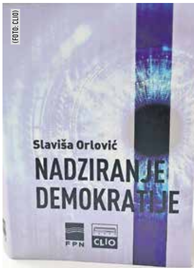
Насловница Орловићеве књиге

Истина и правда одувјек су дијелиле друштва, као што је данас случај са популизмом. Популисти успјешно користе сукобе, чак и подстичу поларизацију у друштву. Њихови политички противници су „непријатељи народа“ („ко није са нама, тај је против нас“ – „против народа“). Треба их искључити. Поларизација је средство опстанка на власти и мобилизација у односу на „непријатеље народа“. Таквих примјера било је и у демократским и у недемократским друштвима. У демократији разли-