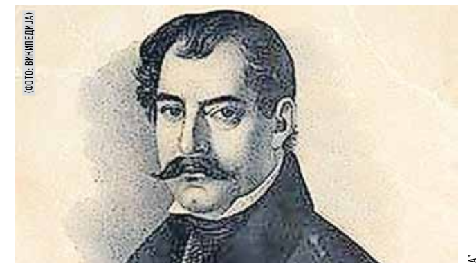
Аврам Петронијевић, рад Анастаса Јовановића

Занимљиво је, иако на први поглед чудно, да је Петронијевић био један од првих индустријалаца у Србији.