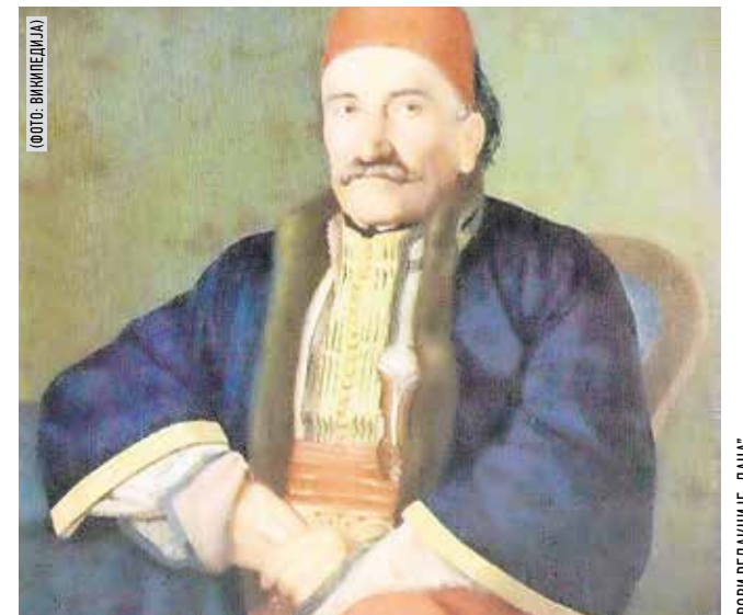
Тома Вучић Перишић

Послије тога, до јуна 1843. године, био је министар унутрашњих дјела, када га је на том положају замијенио Илија Гарашанин. Никада више није заузимао ниједан министарски положај, али је био члан Државног савета. Ипак, поредак коме је знатно допринио да се успостави, уставобранитељски, ломио га је у политичком погледу, током година, полако и сигурно. С кнезом није био у односима које је очекивао, најближим, а људима које је кнез око себе окуљао на Двору био је највећи могући противник. Те учене Србе из Аустрије, не само на Двору, већ и