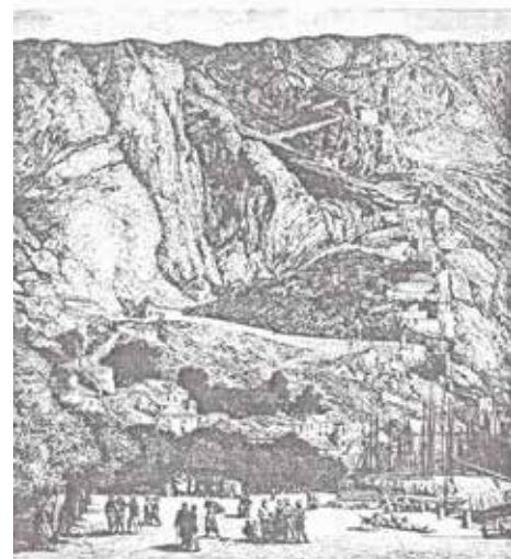
Поглед на Котор и тврђаву Св. Јован

Дакле, у вријеме доласка краља Уроша на престо на територији српске државе дјеловале су три црквене организације: Српска, Дубровачка и Барска архиепископија. Посебан црквени положај имао је град Котор који је од прије 1063. био потчињен Баријској архиепископији са супротне стране Јадрана. Српска архиепископија у вријеме Арсенијевог архиепископата обухватала је, као и у Сави-