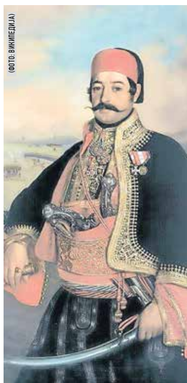
Стеван Петровић Книћанин, слика Уроша Кнежевића

удаљавати од човјека који га је, такорећи, сам довео на престо Србије. Книћанин је био таква политичка громада од које је морао зазирати и сам Вучић. Кнез се уз њега осјећао безбједно на престолу. У покрету Срба у Војводини и рату са Мађарима (1848/1849), као један од главнокомандујућих над добровољцима из Кнежевине, истакао се великим јунаштвом, нарочито у биткама код Беле Цркве, Томашевца, Титела, Вилова, Панчева и Мошорина. Његова популарност међу Србима са обје стране Дунава и Саве израсла је до невиђених размјера. Редовно је о свему извјештавао кнеза, а једном му је на поклон послао читаво јато фазана да их кнез гаји код Топчидерског конака. Книћанин је из рата изашао као велики херој, а за показана знања у командовању дивео му се и школовани официр Фрања Зах. За јунаштво је добио многа признања и ордење: од аустријског цара Фрање Јосифа, руског цара Николаја I Романова, патријарха Рајачића и црно-