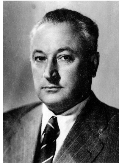
Slika 3. Rade Pribićević, ambasador Jugoslavije u Poljskoj od 1947. do 1950. i u Kanadi od 1950. do 1952.

Boravak u Berlinu i Londonu pomogao mi je da promene koje se dešavaju u savremenom svetu sagledam i iz ugla drugačijeg od onog akademskog. U Nemačkoj sam se, kao ambasador, pored ostalog bavio pitanjima evropskih integracija Srbije, a u UK sam bio ambasador tokom oba referenduma – škotskog i evropskog. Nakon povratka iz Londona nastavio sam, kao naučnik, da se bavim pitanjima međunarodnih odnosa. U ovoj knjizi o tom novom, drugačijem svetu pišem o Bregzitu, britanskoj spoljnoj politici nakon izlaska iz Evropske unije, velikoj krizi evropske socijaldemokratije i lideru britanskih laburista