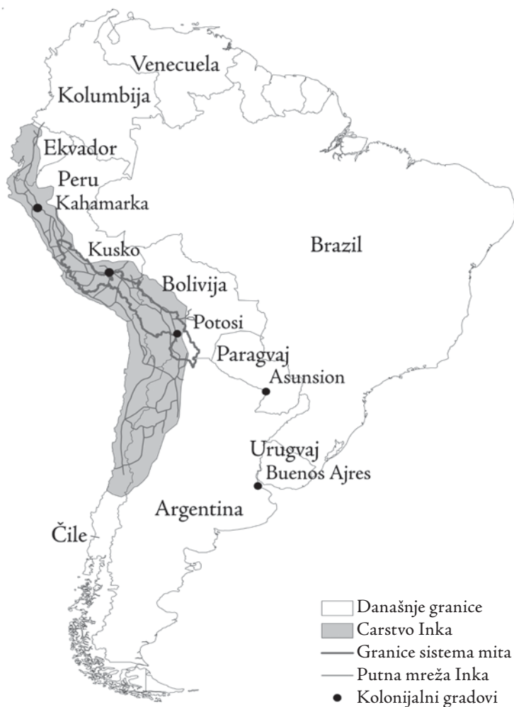
Karta 1: Carstvo Inka, putna mreža Inka i regrutaciona oblast mite za rudnike

Zanimljivo je da su posledice mite prisutne i u današnjem Peruu. Uzmimo kao primer razlike između susednih provincija Kalka i Akomajo. Čini se da su neznatne. Obe se nalaze u visokim planinskim oblastima, a njihovo stanovništvo čine potomci Inka koji govore kečua